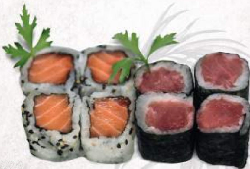
Uramaki de Salmão